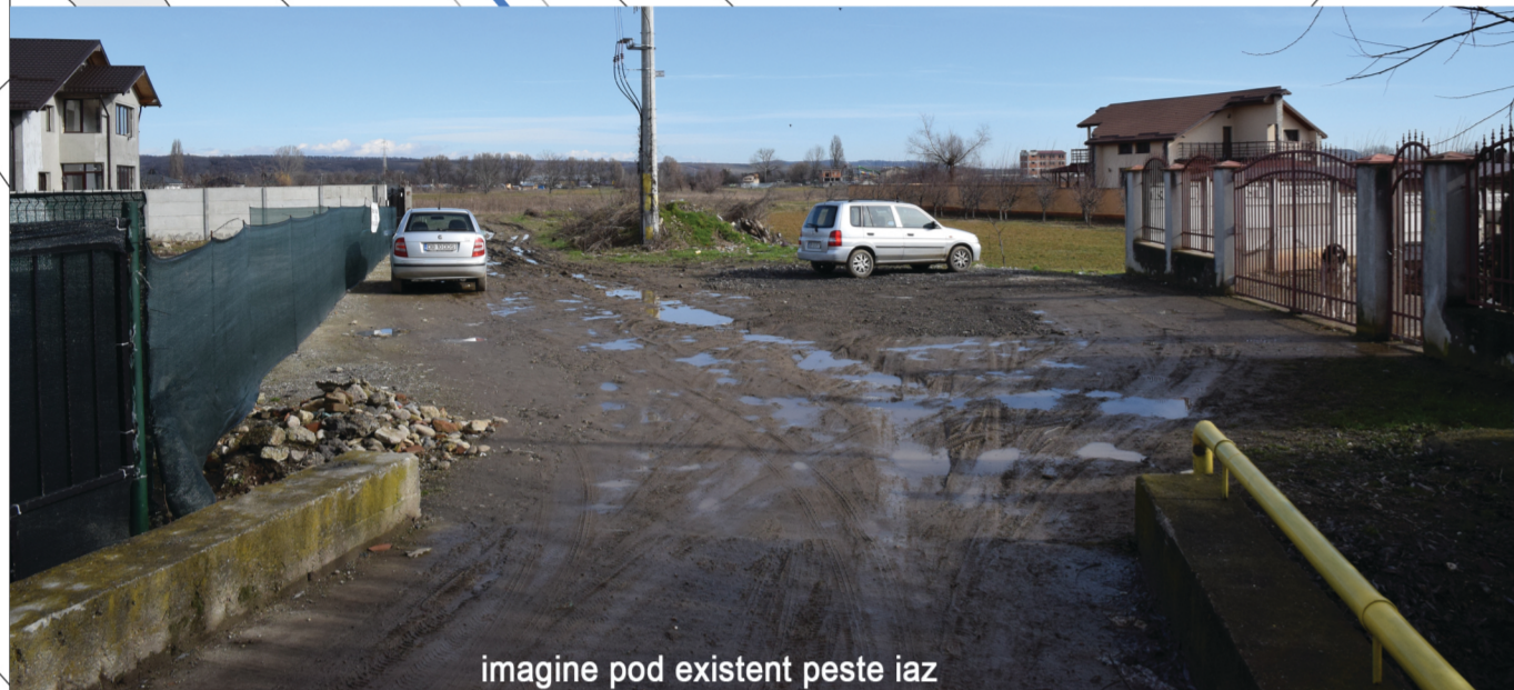
imagine pod existent peste iaz